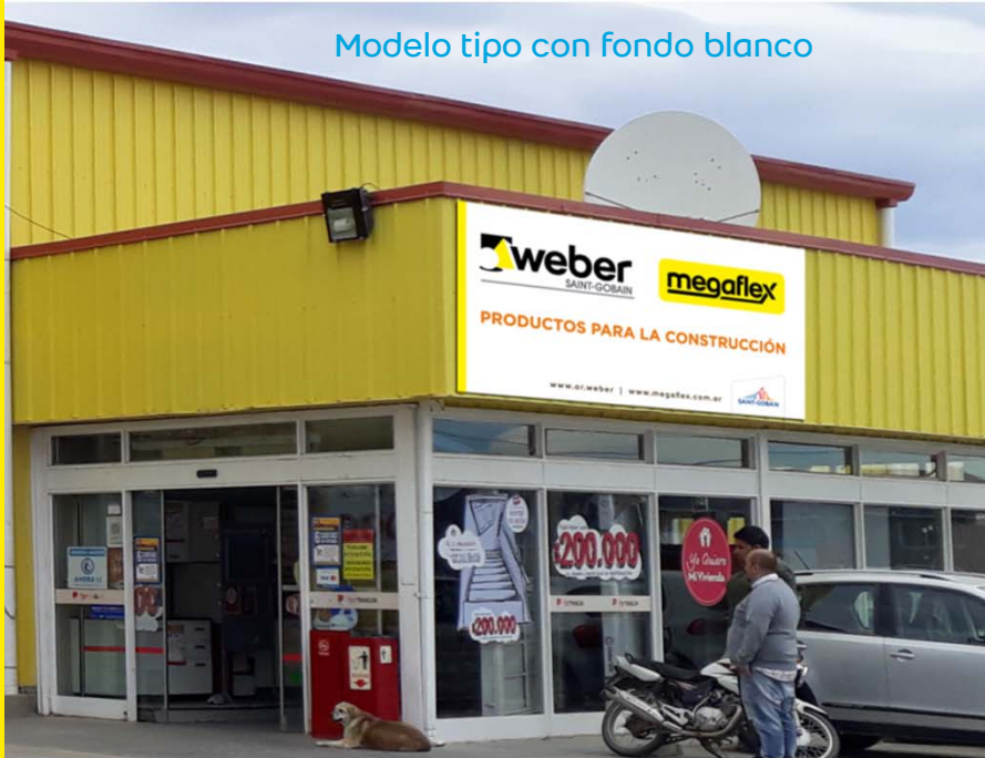
Modelo tipo con fondo blanco